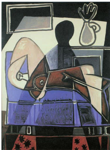
Pablo Picasso, The Shadow on the woman, 29 Δεκεμβρίου 1943, Art Gallery of Ontario, Toronto