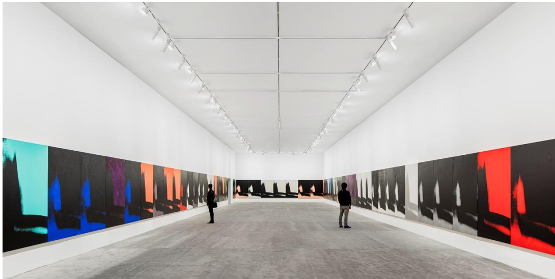
Installation view of ANDY WARHOL's exhibition "Shadows" at Yuz Museum, Shanghai. Collection Dia Art Foundation, New York. Copyright The Andy Warhol Foundation for the Visual Arts, Inc./ Artist Rights Society (ARS), New York. 8

Είμαστε εμείς που δίνουμε ζωή στη σκιά ως πηγή της, ως δημιουργοί της και καλλιτέχνες ή είναι εκείνη που δημιουργεί το ίχνος που αφήνουμε πίσω μας στη γη; Εμείς την καθορίζουμε αλλά εκείνη εκ των υστέρων μας προσδιορίζει; 7